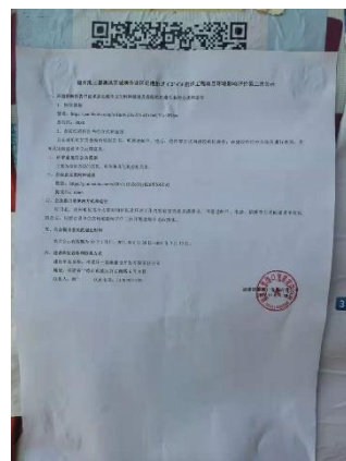
鱼潭村公示点现场照片