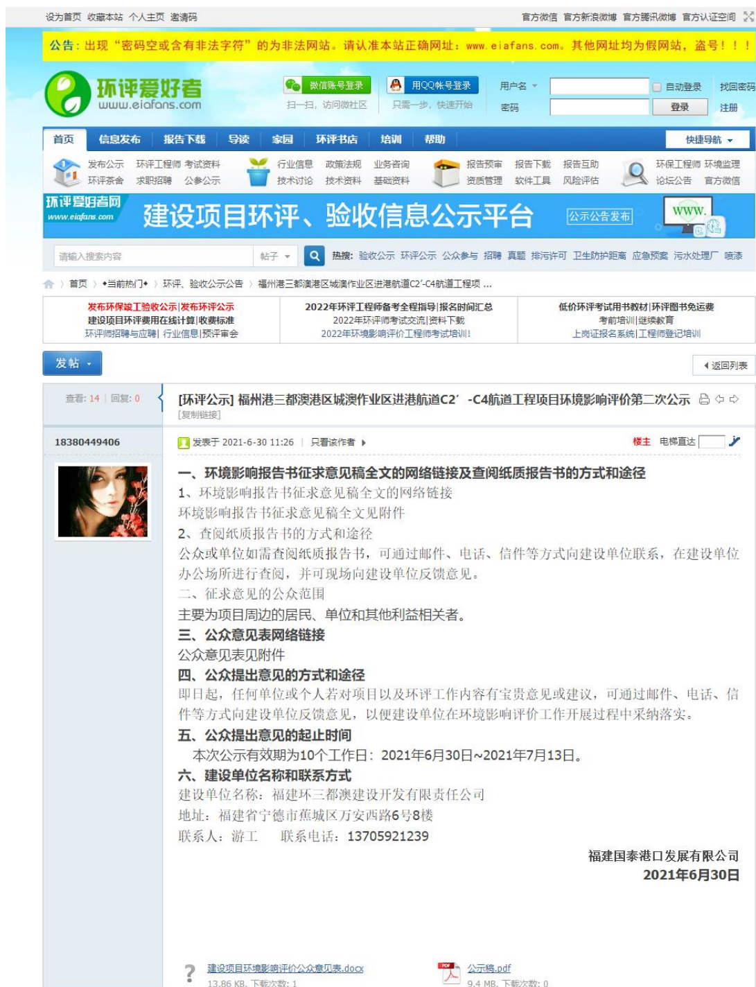
图2 征求意见稿公示截图(网站)