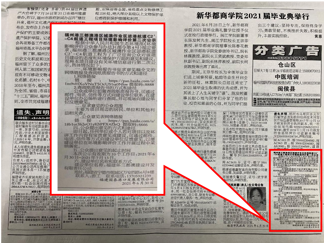
图3 征求意见稿公示截图(报纸)